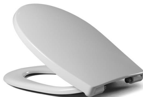
Öffnungswinkel max. 110°