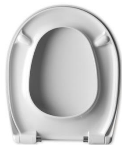
2 Deckelpuffer DP97 2 Sitzpuffer SP15