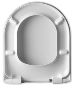
2 Deckelpuffer DP97 4 Sitzpuffer SP97