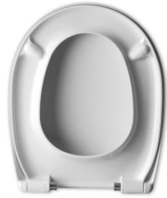
2 Deckelpuffer DP97 2 Sitzpuffer SP15