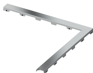
Design "steel II"