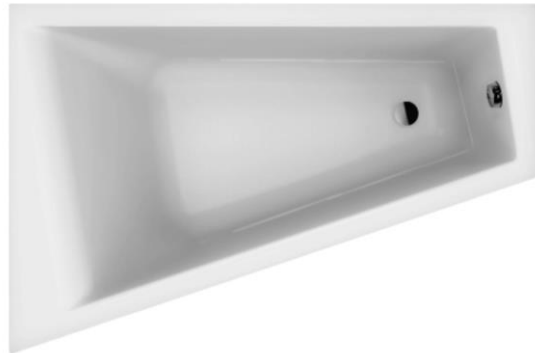
SN 150/100 U links