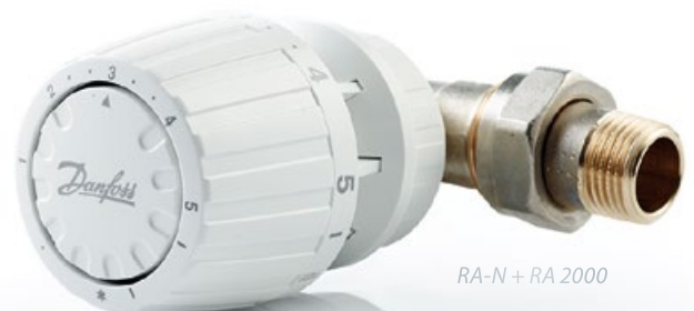
RA-N + RA 2000

Um komfortabel heizen zu können, müssen die Heizkörperventile über eine Thermostatregelung verfügen. So lässt sich die Temperatur in jedem Raum separat regeln. Für alle Kunden, die Wert auf eine optimale Regelung legen und keine Kompromisse hinsichtlich Qualität und Design machen möchten, hat Danfoss eine breite Palette an Heizkörperthermostaten im Sortiment.