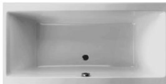
SN 150/75 Duo