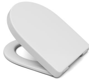
Öffnungswinkel max. 110°