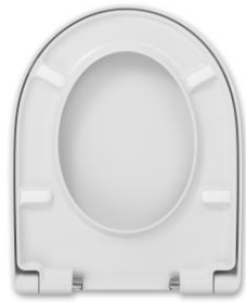
2 Deckelpuffer DP97 4 Sitzpuffer SPQ2