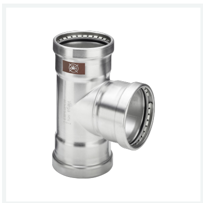
Temponox XL-T-Stück mit SC-Contur Modell 1718XL Artikel 810 221