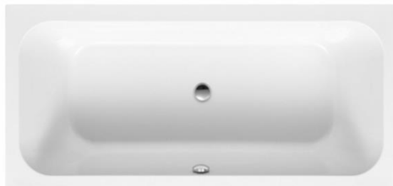
LN 190/90 Duo