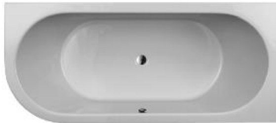
S 170/80 VR

Hergestellt im Vakuum – Tiefziehverfahren auf Aluminium-Werkzeugen. Verstärkung mit glasfaserverstärktem Kunststoff. Herstellung nach DIN EN 198 und DIN EN 14516. Einlaminiertes Bodenbrett der Stärke 12 mm zur Aufnahme des Fußsystems. Montage mit Badewannenfüßen (siehe Zubehör) o.a. geeignete/zugelassene Montagesysteme. Bodenablauf Mitte. Überlauf Mitte vorn Ab- und Überlaufgarnitur mit Bowdenzug 800 mm Optional mit Pool-, Licht- und Soundsystemen. Optional mit SLIM Rand. Lieferbar in den Farben: weiß