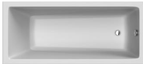
SN 180/80 Mono