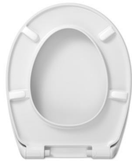
2 Deckelpuffer DP97 4 Sitzpuffer SPQ2