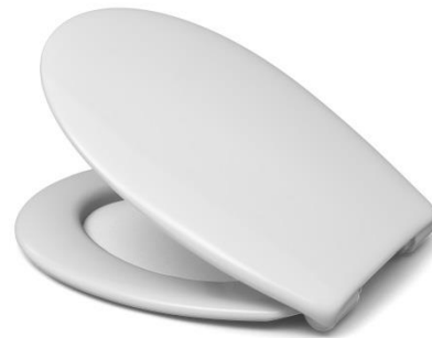
Öffnungswinkel max. 110°