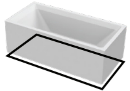
BH 190 Duo Plus Free mit Schürze 4-seitig