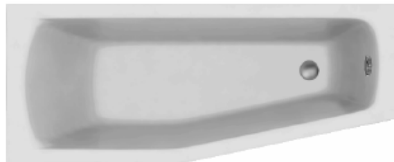
SH 170/70 links