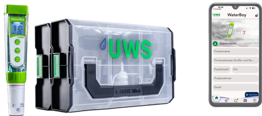
Technische Daten Dualmessgerät WaterBoy:

Dualmessgerät für pH-Wert und Leitfähigkeit inklusiv intuitiver App