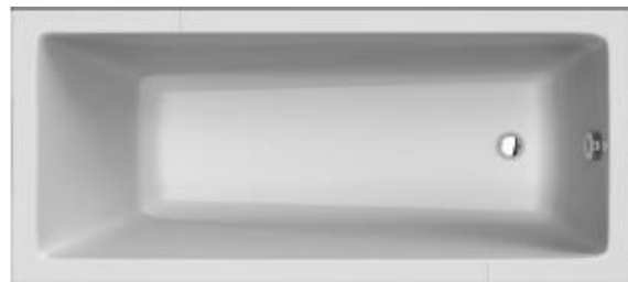
SN 170/75 Mono