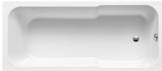
LN 170/75 D