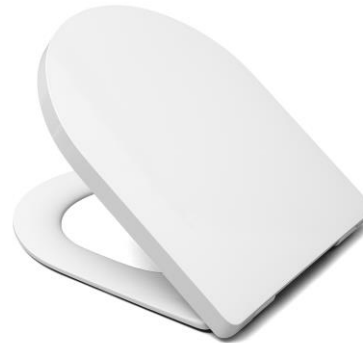
Öffnungswinkel max. 110°