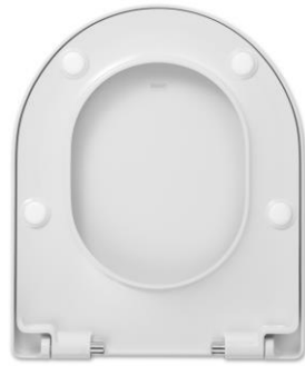
2 Deckpuffer DPV5 4 Sitzpuffer SPV8