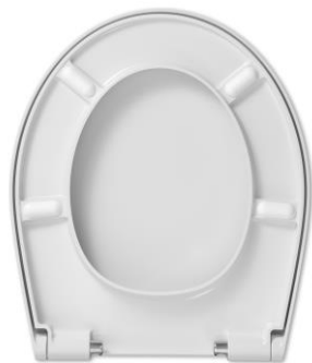
4 Sitzpuffer SP97 2 Deckelpuffer DP97