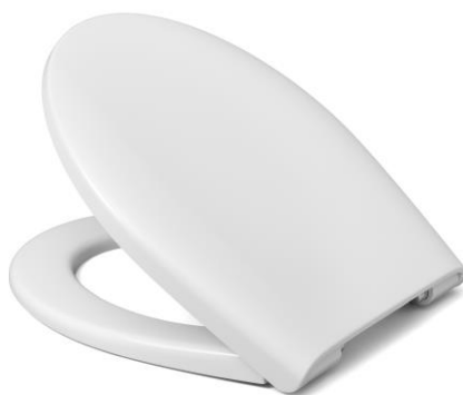
Öffnungswinkel max. 110°