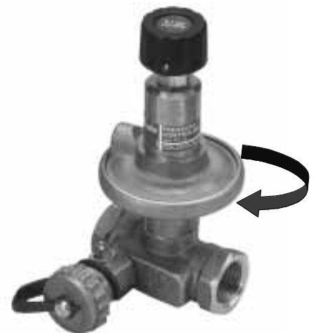
Fig. 5 / Abb. 5