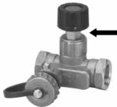
Fig. 4 / Abb. 4