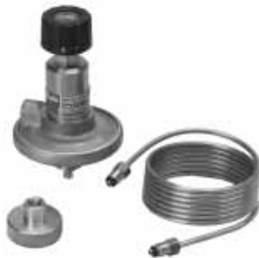
Fig. 2 / Abb. 2