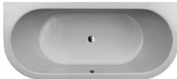
S 170/80 V

Hergestellt im Vakuum – Tiefziehverfahren auf Aluminium-Werkzeugen. Verstärkung mit glasfaserverstärktem Kunststoff. Herstellung nach DIN EN 198 und DIN EN 14516. Einlaminiertes Bodenbrett der Stärke 12 mm zur Aufnahme des Fußsystems. Montage mit Badewannenfüßen (siehe Zubehör) o.a. geeignete/zugelassene Montagesysteme. Bodenablauf Mitte. Überlauf Mitte vorn Ab- und Überlaufgarnitur mit Bowdenzug 800 mm Optional mit Pool-, Licht- und Soundsystemen. Optional mit SLIM Rand. Lieferbar in den Farben: weiß