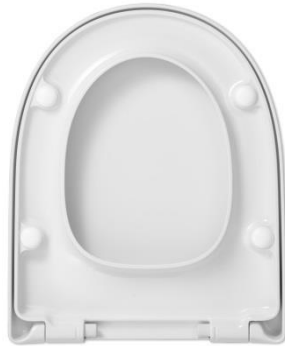
2 Deckelpuffer DP97 4 Sitzpuffer SP16