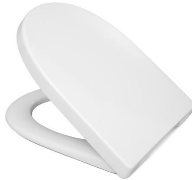
Öffnungswinkel max. 110°